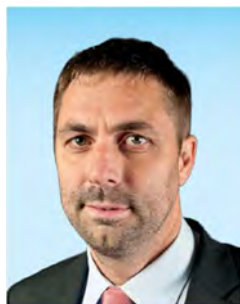
Předseda správní rady Centra kybernetické bezpečnosti, z.ú.,